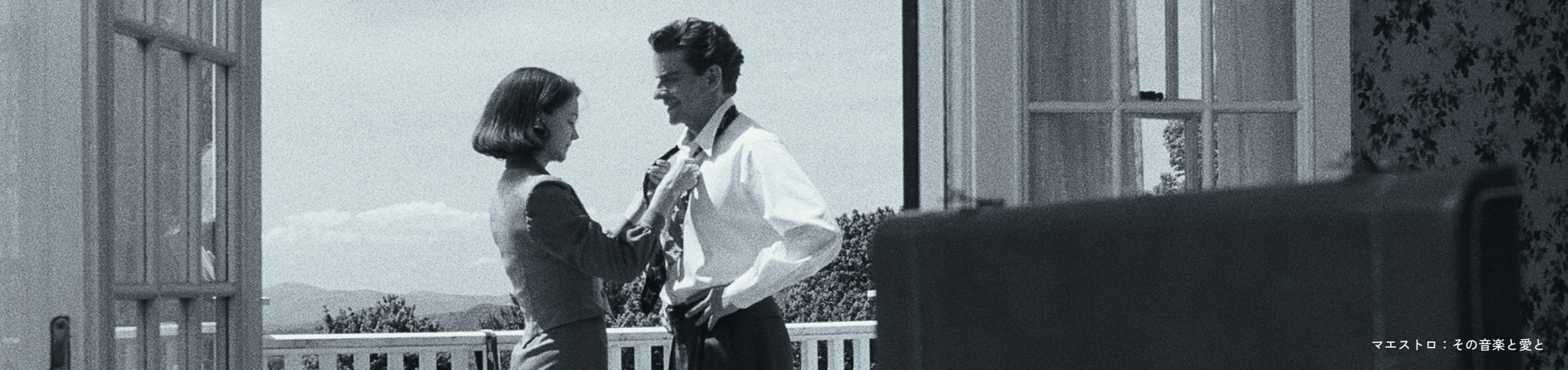
マエストロ：その音楽と愛と