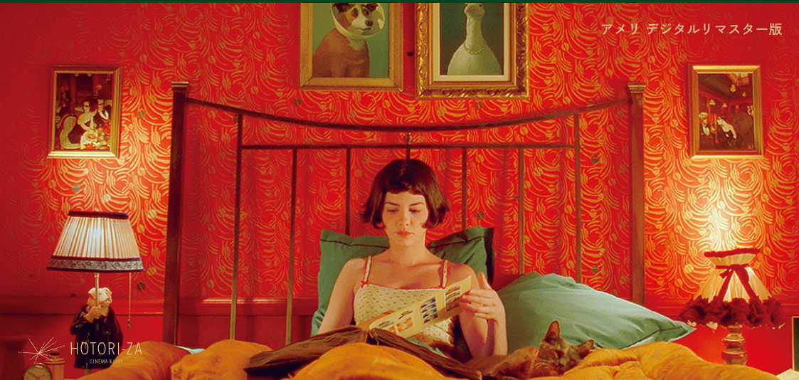
アメリ デジタルリマスター版