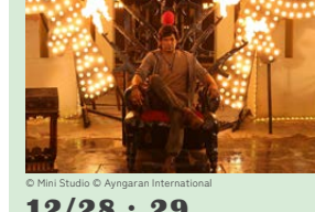
© Mini Studio © Ayngaran International