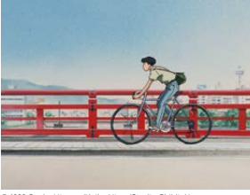
© 1993 Saeko Himuro/Keiko Niwa/Studio Ghibli, N