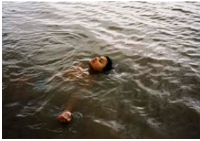
© 2024 House Bird Limited, Ad Vitam Production, Arte France Cinema, British Broadcasting Corporation, The British Film Institute, Pinky Promise Film Fund Holdings LLC, FirstGen Content LLC and Bird Film LLC. All rights reserved.