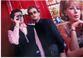
© MACT PRODUCTIONS-LE SOUS-MARIN PRODUCTIONS-INRA-PANTHEON FILM-2024